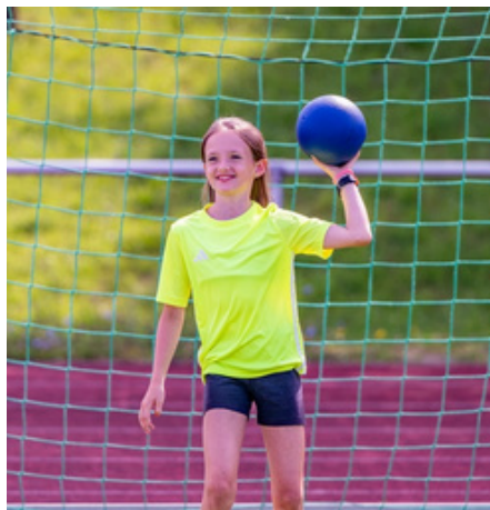
Am Sommerferien-Camp können Kinder von sechs bis zwölf Jahren teilnehmen.

Vom 10.-14. August bieten wir wieder zusammen mit unserem Partner lyfes eine Woche Sport im Kinder-Feriencamp an. Neben jeder Menge Sport, Spiel und Spaß sind die Betreuung von 8:30 Uhr bis 15:30 Uhr durch ein qualifiziertes Trainerteam, Mittagessen, gesunde Snacks, Getränke und ein Adidas Trikot inklusive. Das Camp wird von allen Krankenkassen bezuschusst. Weitere Infos auf unserer Homepage unter Aktuelles und auf www.lyfes.de/hamburg