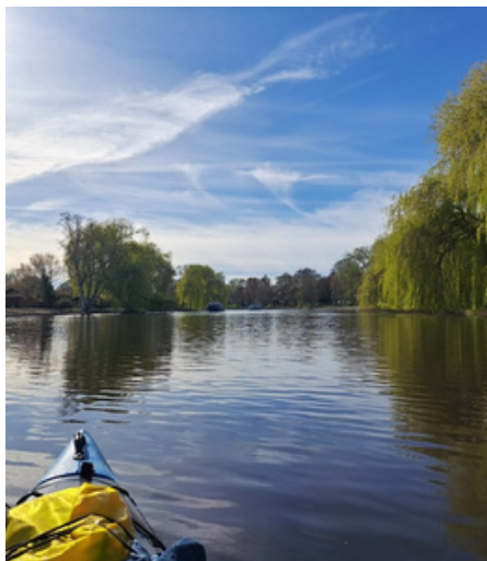
Jeden Mittwoch, 16 Uhr trifft sich die Sparte für eine entspannte Tour.

Unsere Paddler:innen sind in die neue Saison gestartet und freuen sich auf die Ausfahrten in und um Hamburg, den geplanten Workshop "Schöner Kentern" sowie den Besuch der befreundeten dänischen Paddler:innen im Spätsommer. Immer mittwochs startet die Tour durch's Alstertal für Spartenmitglieder und Interessierte vom Bootshaus im Brombeerweg 74. Wer Hamburg einmal vom Wasser aus erleben möchte, schreibt eine Mail an kanu@lsvham.de .