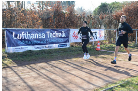
Knapp 500 Läufer:innen starteten beim LHT-Halbmarathon.

Schritt machen: Ende April bekamen wir die tolle Nachricht, dass die dringend notwendige Sanierung der LSV-Sportanlage ausgewählt wurde, einen Zuwendungsantrag beim Bund zu stellen. Damit kann der LSV nach Genehmigung der entsprechenden Bundesbehörde auf Mittel in Höhe von 3,767 Millionen Euro zugreifen! 55% davon werden von der Stadt Hamburg und 45% vom Bund zur Verfügung gestellt. Sobald das Vorhaben genehmigt wurde, kann mit dem Projekt begonnen werden. Es bleibt dennoch