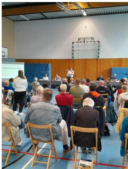
Am 27. Mai findet die Jahreshauptversammlung des LSV statt.