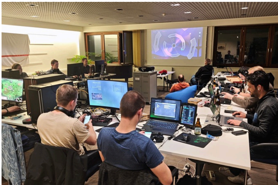
15 Gamer trafen sich bei der ersten LAN-Party der Sparte E-Sport im LSV-Tagungsraum. Weitere Treffen mit mehr Spieler:innen sind geplant.

Neue Mitglieder sind herzlich willkommen und können sich für weitere Informationen mit einer Mail an e-sport@lsvham.de an den Spartenvorstand wenden.