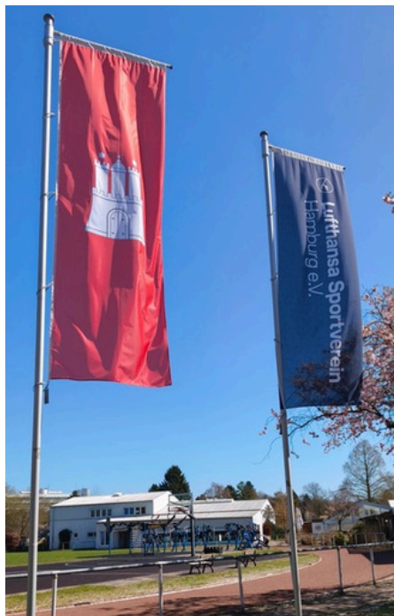
Die Sanierung der Sportanlage hat endlich begonnen.