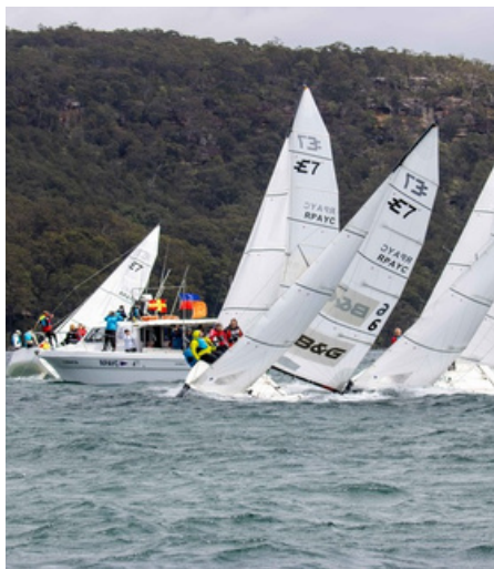
2024 fanden die World Airline Sailing Championships in Australien statt.

In diesem Jahr haben wir die Ehre, die 52. World Airline Sailing Championships auszurichten. Vom 14. bis 19. Juni werden 70 Seglerinnen und Segler von zwölf Airlines aus zehn Ländern bei uns zu Gast sein, um gemeinsam die Regatta zu segeln. Stattfinden wird dieses großartige Event, das auch in die ASCA-Wertung (Airlines Sports and Cultural Association) eingehen wird, in Borgwedel an der Schlei. Zuschauer:innen können jederzeit vorbeischaun.