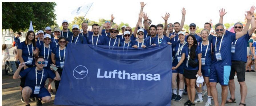
Das Highlight des Betriebssports findet dieses Jahr in Dänemark statt, die World Company Sport Games, bei dem auch das OneTeam Lufthansa Group dabei sein wird.